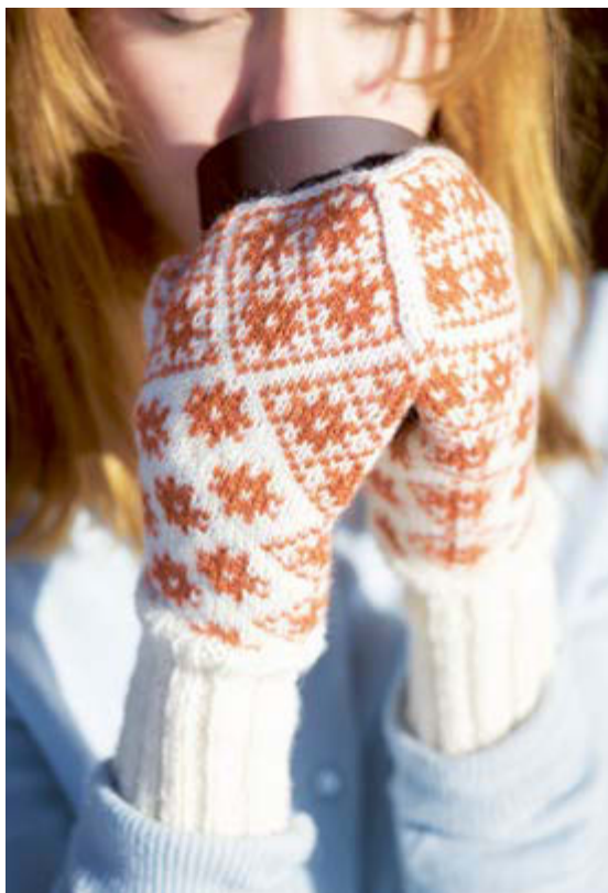
316-3 Stjernerdyssvotter til dame i 2-tråds Gammelserie