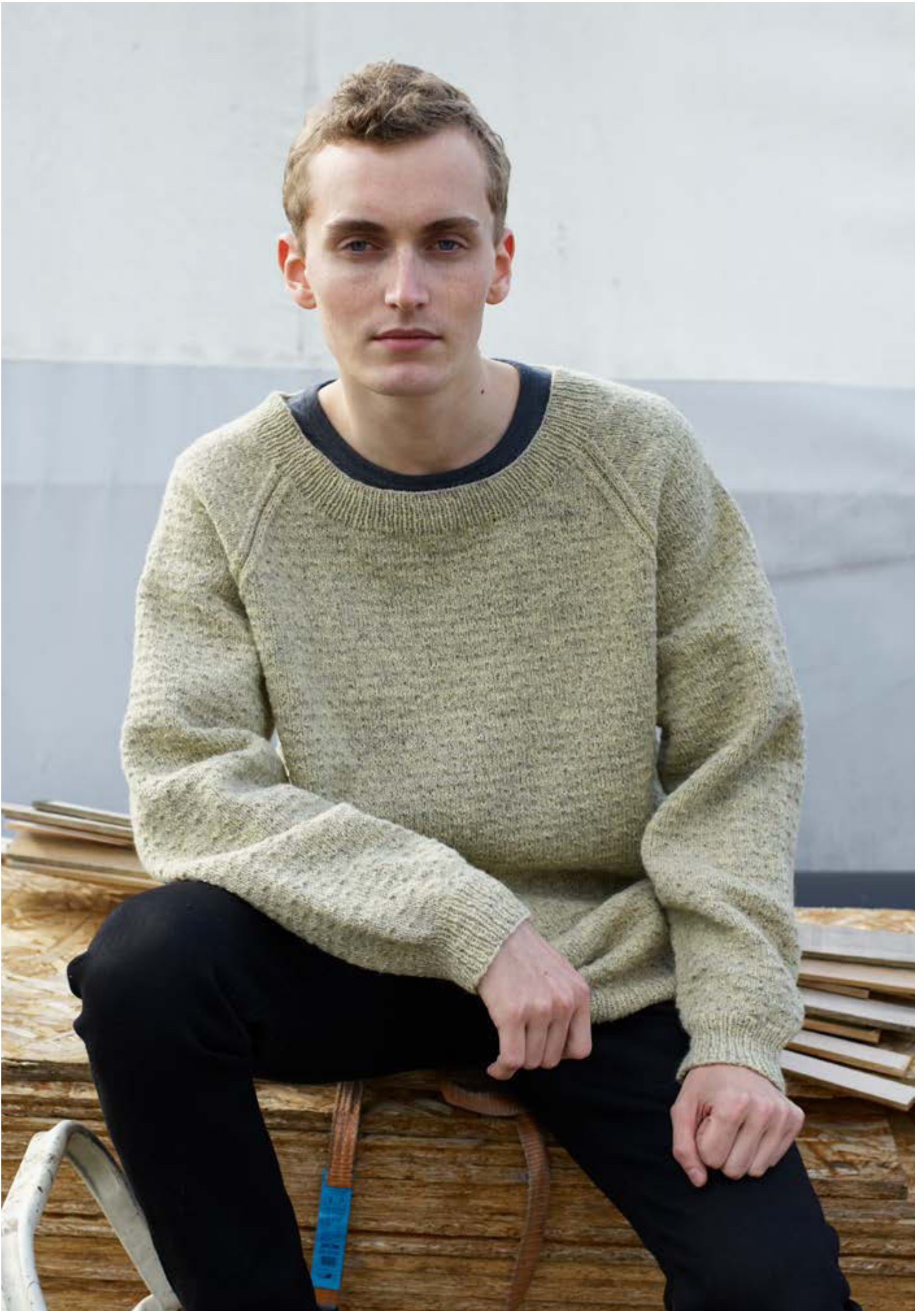
312-10 Chiefgenser i Finull